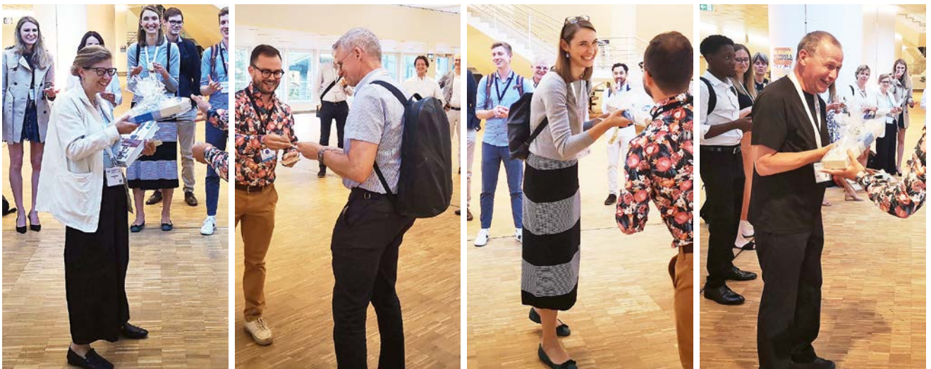
Abb./Fig. 5 Die Gewinnerinnen und Gewinner bei der Übergabe ihrer Preise. / Les gagnant(e)s en train de recevoir leurs prix.