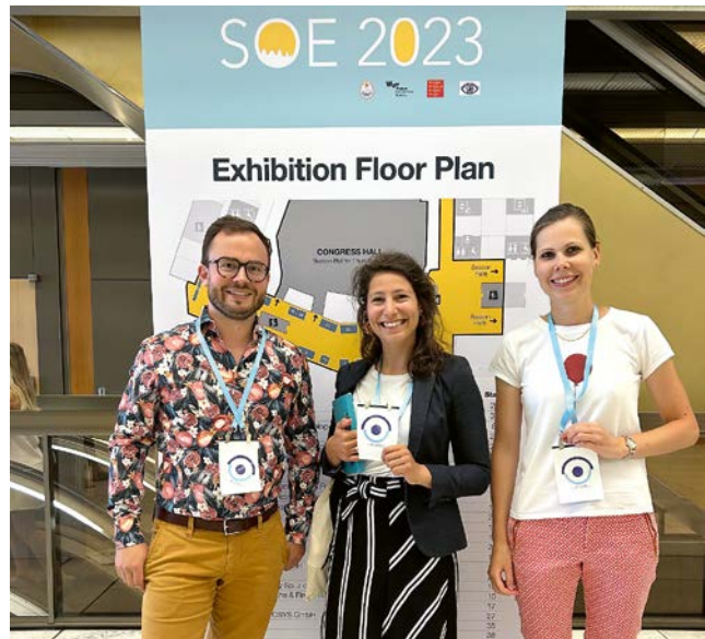
Abb. 2 Die YSO-Delegation vor dem Kongress-Banner des SOE in Prag.

Au-delà de ces échanges professionnels, l'aspect social n'a évidemment pas été négligé et la délégation des YSO a pu rentrer en Suisse avec un réseau social élargi, de nombreuses idées et une motivation renforcée, afin de continuer à améliorer la formation des jeunes ophtalmologues. •