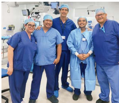
L'équipe du bloc opératoire et moi pour le dernier jour de travail.

très bien équipé avec des lampes à fente Haag-Streit® dans tous les bureaux, trois OCT Spectralis Heidelberg®, un Optos®, trois champs visuel Humphrey®, deux microscopes chirurgicaux Leica® avec des machines Bausch & Lomb Stellaris®. Etant indépendant en chirurgie de la cataracte, j'ai obtenu rapidement ma propre demi-journée de cataractes. J'ai pu également demander d'être formé en orbitoplastics durant deux demi-journées avec une demi-journée de bloc opératoire.